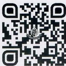
ลิงค์สมัคร

(๒) การชำระเงินค่าธรรมเนียมในการสมัครสอบ ตั้งแต่วันที่ ๑๙ เมษายน ๒๕๖๖ และสิ้นสุดภายในเวลา ๒๔.๐๐ น. ของวันที่ ๒๘ เมษายน ๒๕๖๖ ทั้งนี้ การรับสมัครสอบจะมีผลสมบูรณ์ เมื่อชำระค่าธรรมเนียมในการสมัครสอบเรียบร้อยแล้ว และได้ดำเนินการครบทุกขั้นตอนภายในวัน เวลา ที่กำหนด โดยผู้สมัครสอบสามารถชำระเงินได้ โดย ผู้สมัครสอบสามารถสแกน QR Code ชำระค่าลงทะเบียนผ่านแอปพลิเคชันของทุกธนาคาร และให้แนบหลักฐานยืนยันการชำระเงินได้ที่ https://bit.ly/3HBfQeO