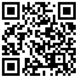
วุฒิการศึกษา